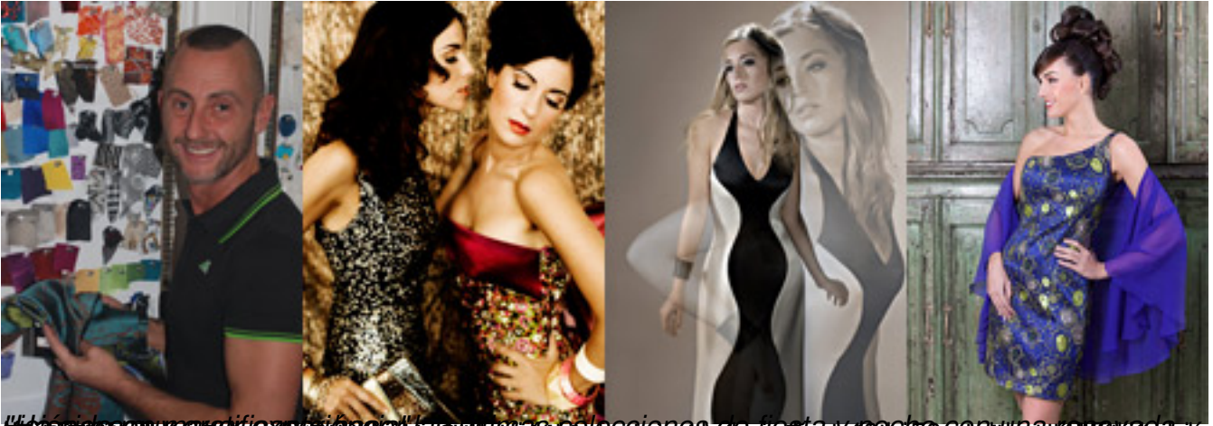
Witajcie na stronie poświęconej Estanislao Solsena Semente. http://www.estanislao.com